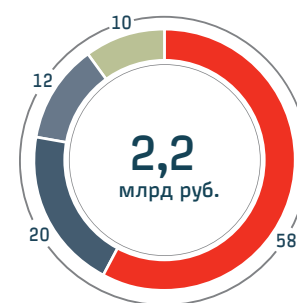
Структура прочих расходов, %

В рамках реализации Концепции по управлению непрофильными активами Компании в 2016 году произведена безвозмездная передача в муниципальную собственность низколиквидных активов, имеющих в большей степени социальное назначение (объекты ЖКХ, здравоохранения, образования Амурской области, а также автодорожные путепроводы и объекты дорожной инфраструктуры в Республике Татарстан и Вологодской области), с остаточной стоимостью 2,2 млрд руб.